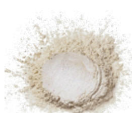
PEARL FINE DUST COD.: 105051-D