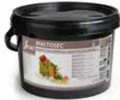
MALTOSEC COD.: 58050030-D