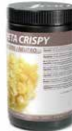
NEUTRAL PETA CRISPY COD.: 58500002-D