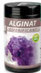
ALGINAT COD.: 58050016-D