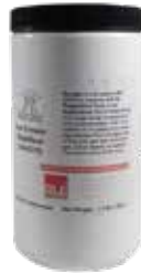
STABILIZADOR SORBET COD.: DAN064-D