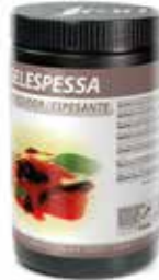
GELEPESSE COD.: 58050011-D