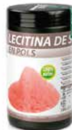
LECITINA POLVO COD.: 59000016-D