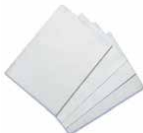
PAPEL DE ARROZ COD.: 78-811-D