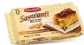
LADY FINGER COD.: 015-D