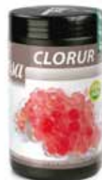
CLORUR COD.: 58050017-D