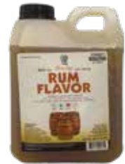
RUM FLAVOR COD.: PS00071-D