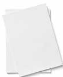
PAPEL COMESTIBLE COD.: PHOTO1-D