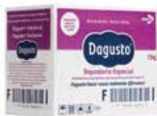
DAGUSTO REPOSTERÍA COD.: 8781-D