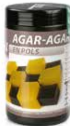
AGAR-AGAR COD.: 58050115-D