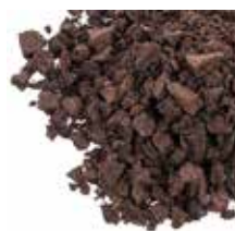
COOKIES AND CREAM 30LB COD.:2002023-D COOKIES AND CREAM 5LB COD.: 2002023-D5