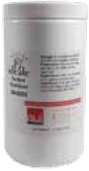
STABILIZER ICE CREAM COD.: DAN030-D