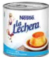
LECHERA LECHE CONDEN COD.: 11296538-D