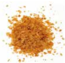
PAILLETE FEUILLETINE COD.:118724-D