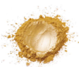
GOLD FINE DUST COD.: 105053-D