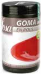
GOMA XANTANA COD.: 58050018-D